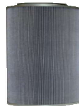
Cartuccia in poliestere 99% diam 225 mm h 250 mm